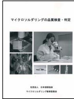
マイクロソルダリングの品質検査・判定