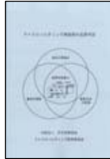
マイクロソルダリング 実装部の品質判定