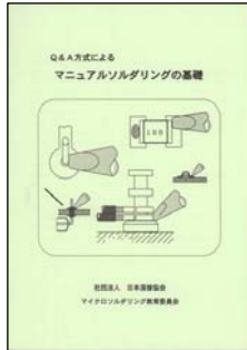
Q&A方式によるマニュアル ソルダリングの基礎