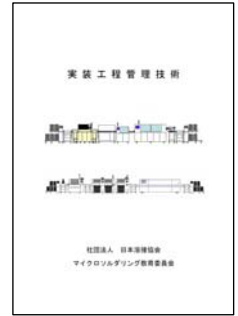
実装工程管理技術

一般社団法人日本溶接協会では、マイクロソルダリング技術に関する教育を、テキストの発行や認定資格に対応したセミナーの開催により行なっております。AOPR・OPR・ISP・PEG・APEの共通知識に対応した『 マイクロソルダリングの基礎 』は、基礎学科セミナーのテキストとして活用しており、基礎学科試験対策用に「問題演習」を付属し、判定能力セミナーの検査学科のテキストである『 マイクロソルダリングの品質検査・判定 』（検査学科試験対策用の「問題演習」を付属）と合わせ、平成24年度よりリニューアルしております。