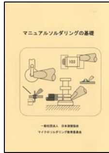
マニュアルソルダリングの基礎