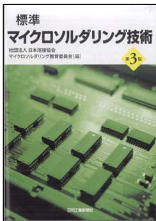
日刊工業新聞社 発刊 定価 3,888円(税込) (社)日本溶接協会 マイクロソルダリング 教育委員会 編

また、本書籍は当協会マイクロソルダリング技術 技術者およびインストラクタ資格のテキストとなっており、その試験に対応した問題集も改訂しました。当協会 マイクロソルダリング技術の資格取得のみならず、社内教育にも使用頂ける内容となっており、数多くの企業の皆様にご活用頂いております。本書籍を通して、マイクロソルダリング技術に関する更なる理解を深めて頂ければ幸いです。